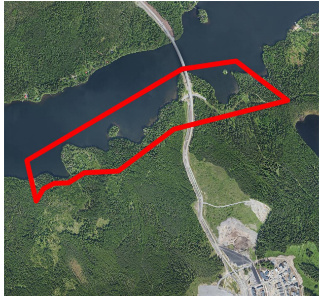
Ilmakuva kaava-alueesta