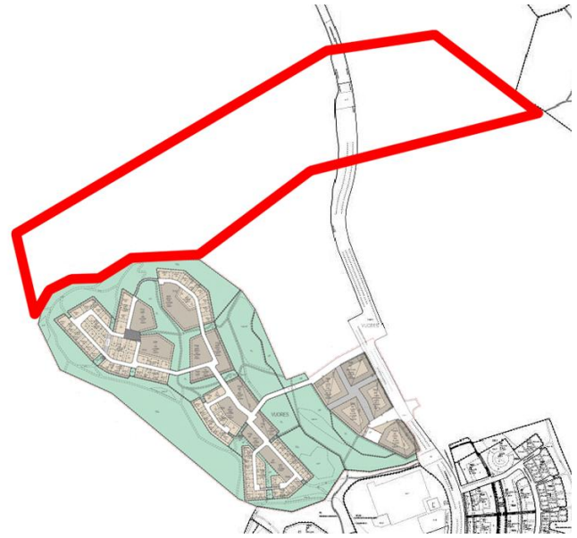
Ajantasa-asemakaava, kaavaluonnos nro 8466 ja kaava-alueen rajaus.

Isokuusen yleissuunnitelman yhteydessä laadittiin mm.